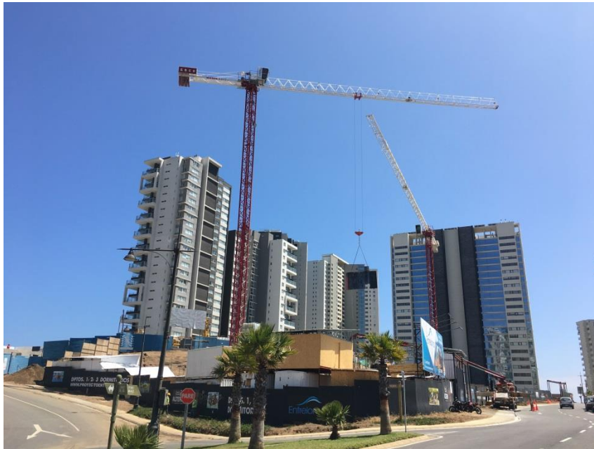
Vista desde Calle Entre Lomas.

Losas de Fundación: Se hormigona la losa de fundación que tiene un espesor de más de un metro. Sobre ésta se encuentra subterráneo -2 en donde se encuentran estacionamientos y bodegas